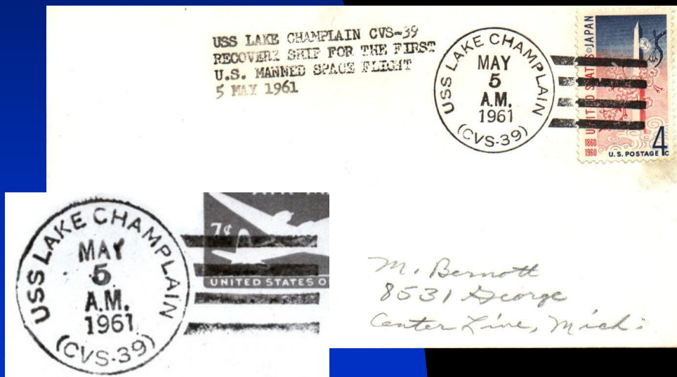
Détail de l'oblitération

Document commémorant le même événement mais entièrement faux y compris les signatures