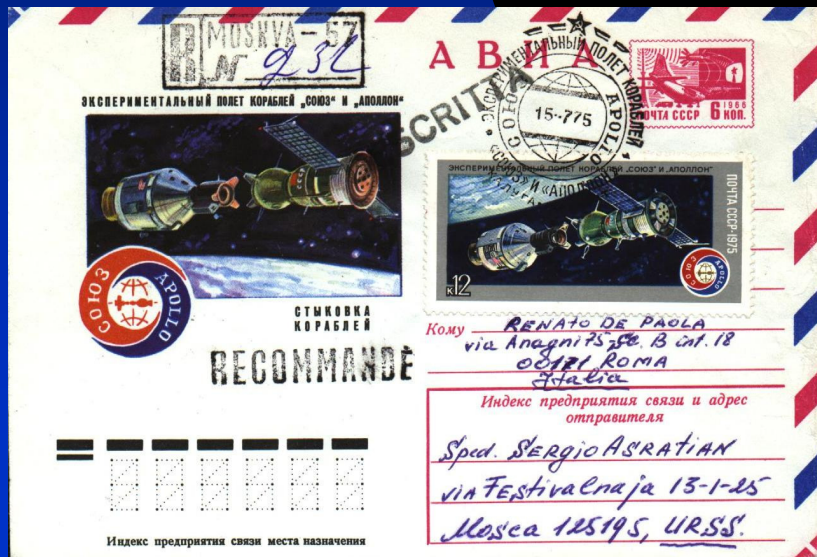
Oblitération de Kaluga mais cachet de recommandation de Moscou. Enveloppes falsifiées grossièrement

15 juillet 1975 : Mission ASTP – Oblit. Kaluga